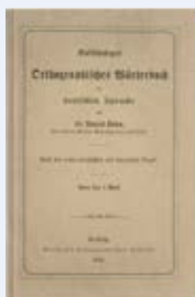
Der Urduden von 1880

Den «Duden» kennt im deutschsprachigen Raum fast jede und jeder. Aber wer steckt eigentlich dahinter? Konrad Duden (1829–1911) war Gymnasiallehrer im damaligen Preussen und trat als Philologe und Lexikograf hervor. Sein im Jahre 1880 erschienenes «Vollständiges Orthographisches Wörterbuch der deutschen Sprache» gilt als der «Urduden». Das Regelwerk und Wörterbuch (27 000 Stichwörter auf 187 Seiten) wurde 1901 auf einer staatlichen Rechtschreibkonferenz für alle Gliedstaaten des Deutschen Reiches für verbindlich erklärt. 1902 schlossen sich Österreich und die Schweiz diesem Vereinheitlichungsbeschluss an. Damit war die einheitliche deutsche Rechtschreibung erstmals in der Geschichte Wirklichkeit. Später übernahm ein privater Verlag den «Duden» und führte ihn von Auflage zu Auflage fort. Staatliche Beschlüsse wie diejenigen von 1901/1902 gab es später keine mehr, aber der «Duden» blieb bis zur Rechtschreibreform von 1996 die unangefochtene Rechtschreibinstanz. «Schlag im Duden nach!» wurde zum geflügelten Wort nicht nur in Rechtschreibfragen, sondern in Fragen zur deutschen Sprache überhaupt. Der Name «Duden» zielt denn nun auch längst nicht mehr nur Rechtschreibwörterbücher, sondern beispielsweise auch eine Grammatik, Sachbücher zu sprachlichen Themen und vieles mehr. In seiner 26. Auflage von 2013 umfasst der Rechtschreibduden 140 000 Stichwörter und 1216 Seiten.